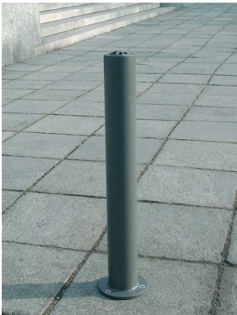
▲ Pollicino può essere dotato di catene.